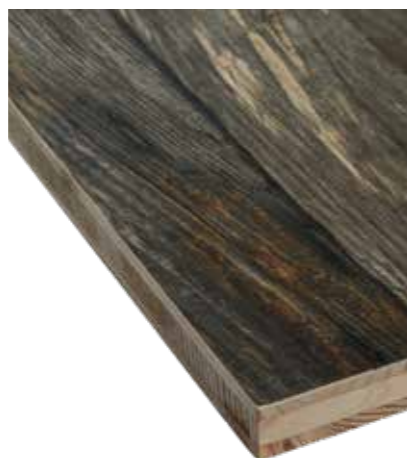
LIGNAPRINT : ÉPICÉA VINTAGE