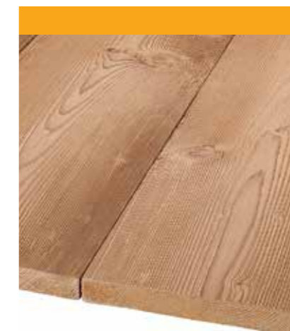
Épicéa antique – Bois massif vieilli