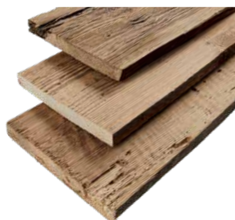
VIEILLES PLANCHES DE CONIFÈRES BROSSÉES