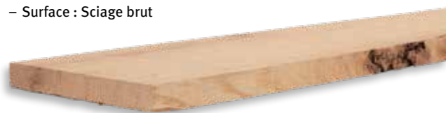
VIEUX BOIS ORIGINAL : CHÊNE SCIÉ