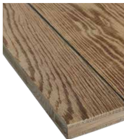
LIGNAPRINT : PIN MODERNE