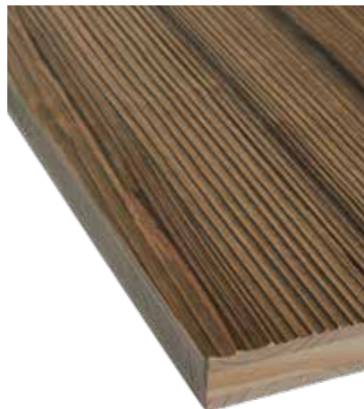
LIGNAPRINT : ÉPICÉA RUSTIQUE