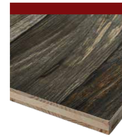
Panneau à 3-couches imprimé numériquement