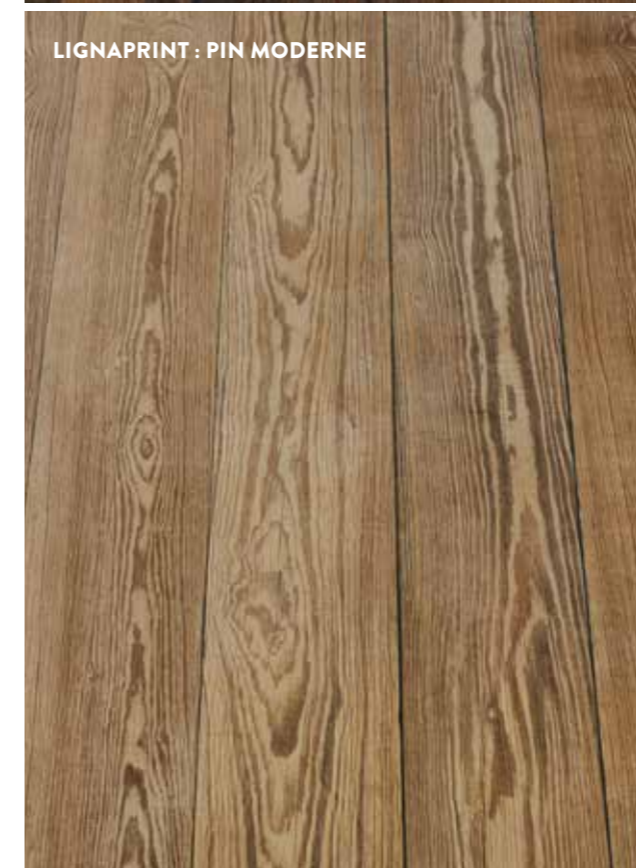
LIGNAPRINT : PIN MODERNE