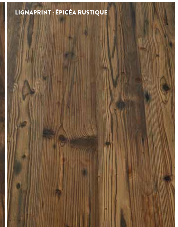
LIGNAPRINT : ÉPICÉA RUSTIQUE