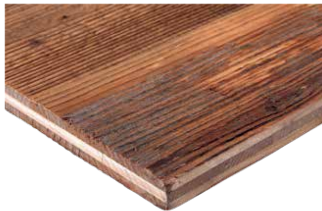
CONSTRUCTION À 3-COUCHES, AVEC DU VIEUX BOIS SUR LES DEUX FACES