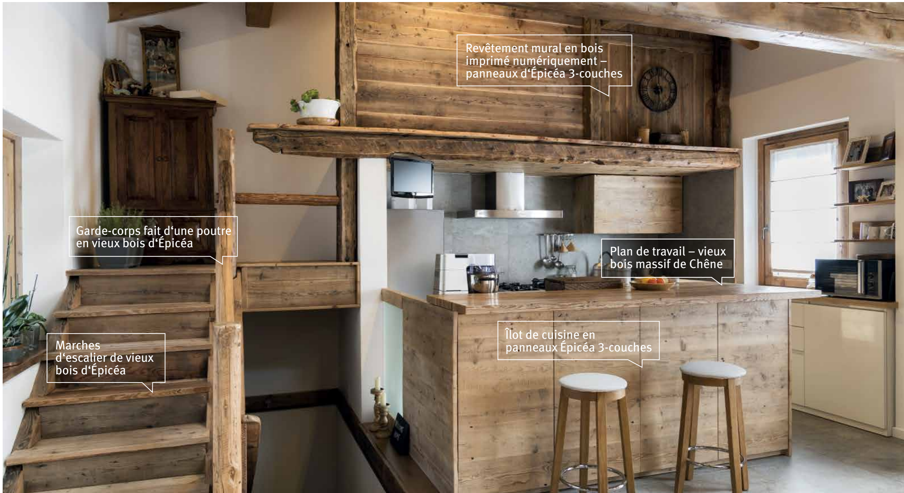
Revêtement mural en bois imprimé numériquement - panneaux d'Épicéa 3-couches