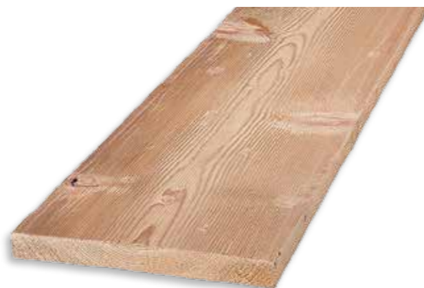
ÉPICÉA ANTIQUE : BOIS MASSIF