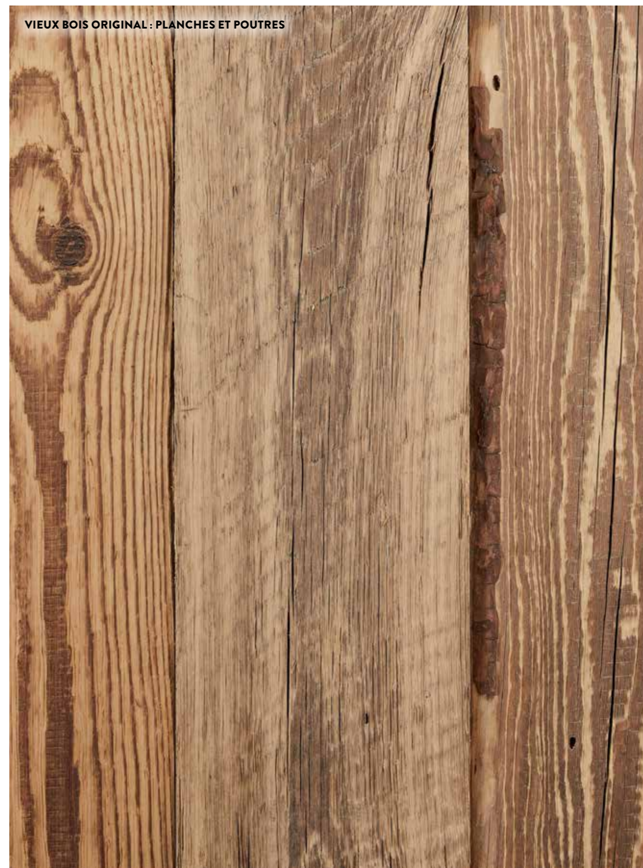
VIEUX BOIS ORIGINAL : PLANCHES ET POUTRES

Le bois récupéré est séché jusqu'à atteindre environ 10% de teneur en humidité. Cela signifie que le bois peut désormais être utilisé dans les intérieurs habités et chauffés, et cela même s'il était utilisé à l'extérieur dans sa vie précédente. Le processus de séchage entraîne la destruction de tous les insectes présents dans le bois. De plus, le vieux bois original est débarrassé de tous les fragments d'acier (ex. clous) au moyen d'un détecteur de métal. Enfin, le broyage permet d'éliminer la saleté et les fibres pelucheuses.