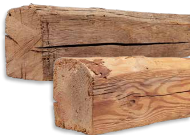
VIEILLES POUTRES DE CHÊNE (EN HAUT) ET DE CONIFÈRE (EN BAS)