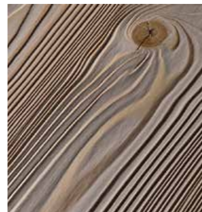
Surface de bois nervurée

Le brossage des surfaces est utilisé pour faire ressortir les reliefs des cernes annuels. Une brosse métallique est utilisée pour gratter le bois initial mou tandis que le bois final plus dur est préservé, et ainsi un relief du bois est obtenu. Cette méthode fonctionne très bien avec les bois conifères mous pour lesquels la structure du bois peut être particulièrement bien travaillée. Dans le cas du vieux bois original, le brossage permet également de retirer la saleté et les fibres pelucheuses.