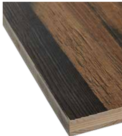
LIGNAPRINT : ÉPICÉA BRUN NOBLE