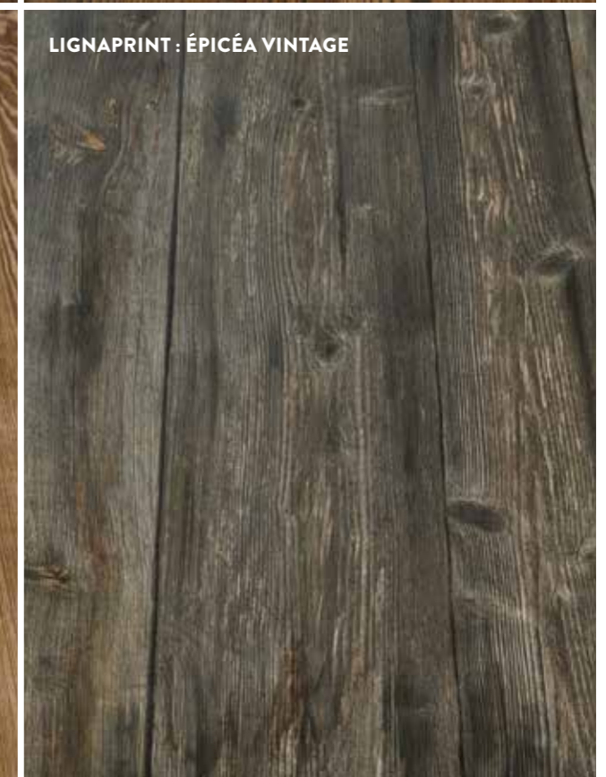
LIGNAPRINT : ÉPICÉA VINTAGE