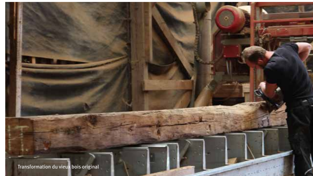
Transformation du vieux bois original