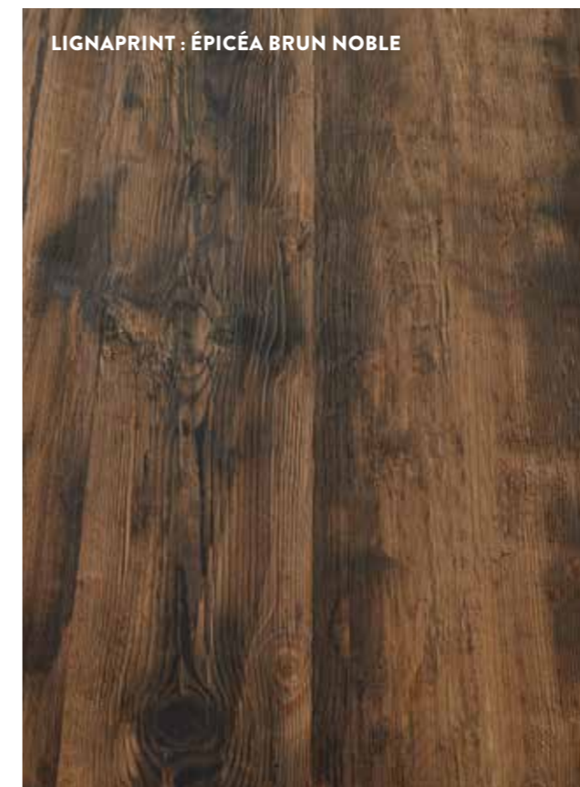
LIGNAPRINT : ÉPICÉA BRUN NOBLE